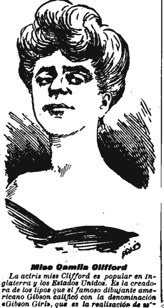
Miss Camilla Clifford La actriz miss Clifford es popular en Inglaterra y los Estados Unidos. Es la creadora de los tipos que el famoso dibujante americano Gibson calificó con la denominación «Gibson Girl», que es la realización de su

Dicha Exposición se abrirá el día 18 de noviembre próximo y terminará el día 18 de diciembre siguiente. Los productores nacionales y extranjeros podrán concurrir como expositores, pero fuera de concurso y sin opción a premio, excluyéndose todo producto natural ó de fabricación que sea similar a los de la provincia. Para detalles é informes se dirigirá toda la correspondencia a la Cámara Oficial de Comercio é Industria de Huesca. San Isidro