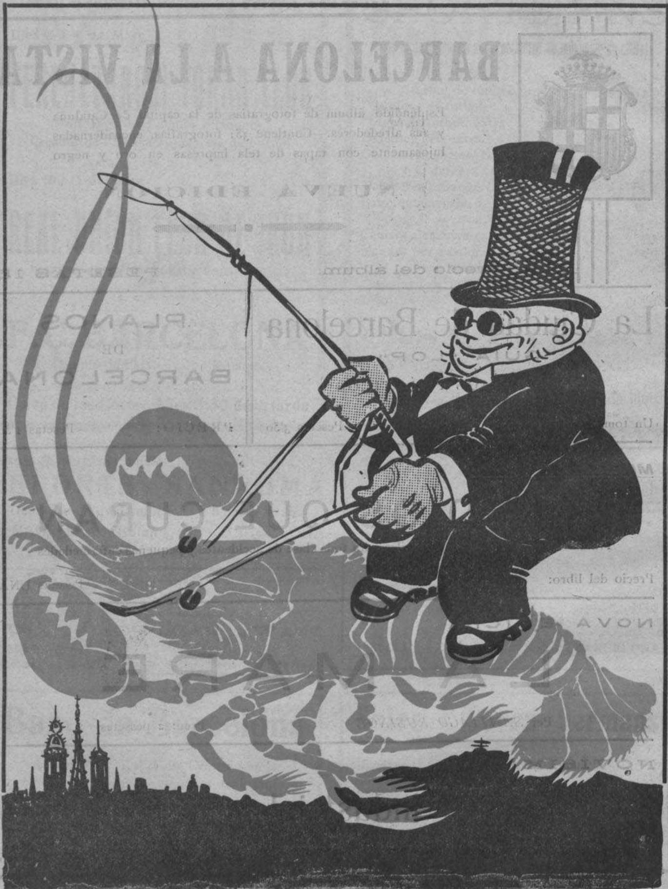
— Amb llagosta vingue'n Quaresmes!

Llibreria Espanyola de Antoni López • Rambla del Mir 20, Barcelona