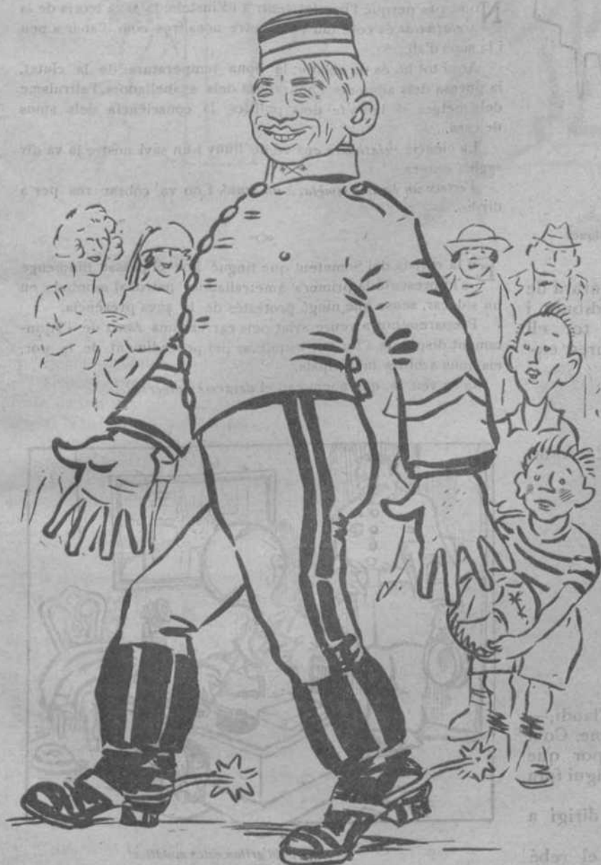
—En Zamora de cavalleria? Trobo que hauria sigut millor de peu.

Si hagués sapigut que l'ofici de Critic portava tanta feina i tantes ensopegades no l'hauria pas triat. Quan jo el vareig pendre era una ocupació tranquil·la de criticón periodístic; hi havia poquets artistes i tots ells pensaven igual: llavors amb tres mides de bombos , un de menut, un de mitjà i un de gros, n'hi havia prou per a tots els casos, i sempre quedaves bé; però ara... et plouen pintures a trompons i artistes a cabassos; et maregen amb vuit o deu exposicions per setmana i si et fixes en les capelletes obertes a