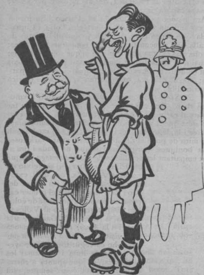
[El governador pren mesures... futbolístiques]

na. Què migrada i trista i febla resulta la pintura de la nostra joventut al costat de la fermesa de dibuix i de construcció d'aquest foraster entusiasta, tot ell braó, que el mateix fa un quadre plé de figures expressives que un paisatge imponent.