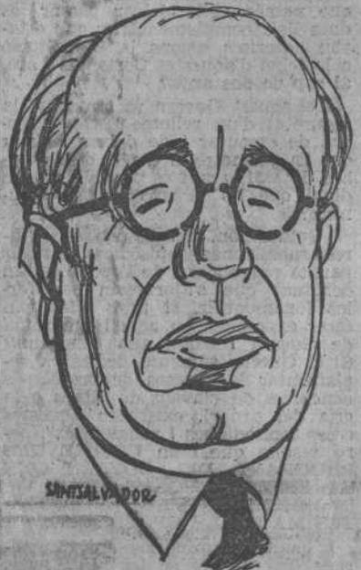
AZANA (per Santsalvador)

Aquesta i no altra, és la tremenda pregunta que pot fer-se avui la democràcia republicana davant la nota publicada aquests dies per totes les minories republicanes antiministerials — en una absurda barreja de dretes i d'extremes esquerres — fixant la seva posició en relació a la guerra civil.