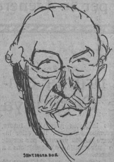
LERROUX (per Santsalvador)

Catalunya? Ah! Potser és arribada l'hora que el nostre poble faci sentir, amb la representació popular del seu Parlament, la veu d'un poble que, gràcies a la democràcia republicana, ha vist reconeguda una autonomia i una dignitat civil. Potser és arribada l'hora que els nostres diputats declariïn solemnement davant de la República quin és el pensament i la decisió del nostre poble català davant la guerra que les minories antigovernamentals s'acaben de declarar, no solament al Govern Azana, que això tindria una importància relativa, sinó al règim parlamentari i democràtic que cons-