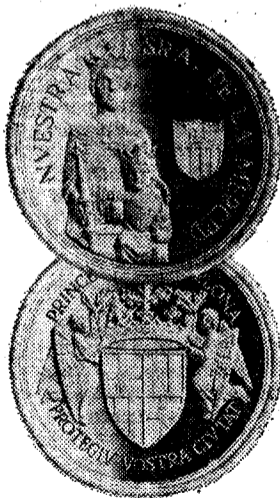
Anverso: Imagen de Nuestra Señora de la Merced, patrona de Barcelona. Reverso: Escudo de la ciudad. Leyenda: «Princesa de Barcelona, protegió vuestra ciutat» tomada de los «golgs» de la Virgen.